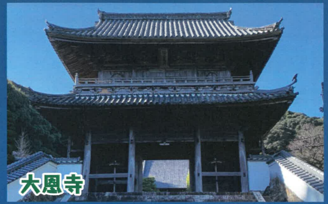
大恩寺 山門が県指定文化財となっています。大恩寺の「大恩」とは、徳川家に大恩のある寺として名付けられました。