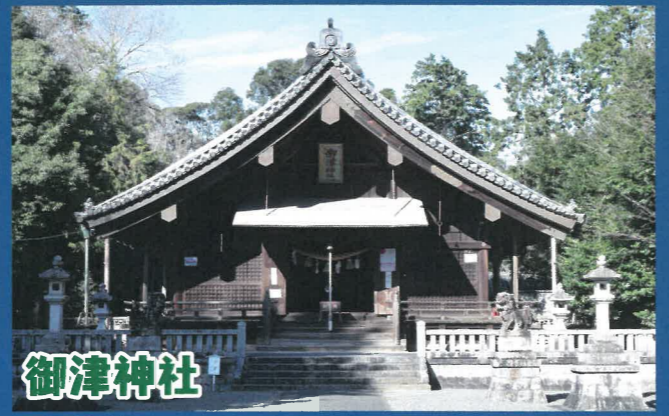
御津神社 おおくにゆしのみこと 大國主命が祭神とされ、創建は紀元前と言われる大変歴史のある神社です。境内にそびえる大楠は樹齢1000年を超える神社のシンボルです。